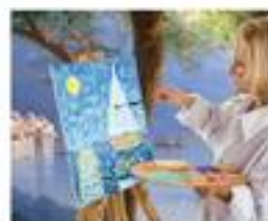
■ Знакомство с творчеством художника Айвазовского