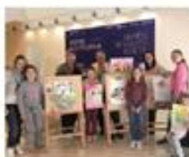
■ Рисуем сказку