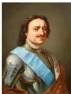
И. Подольников Портрет Петра I, сер. XVII в.

ЛЕКЦИЯ ОСНОВАНА НА ИСТОРИЧЕСКИХ СОБЫТИЯХ ГОСУДАРСТВА РОССИЙСКОГО 1698 г., ОБ ОДНОМ ИЗ САМЫХ ИЗВЕСТНЫХ ВНЕШНИХ СОБЫТИЙ В ИСТОРИИ ВОСКРЕСЕНСКОГО НОВО-ИЕРУСАЛИМСКОГО МОНАСТЫРЯ.