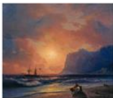
И. Алтманский Закат солнца на море. 1865

В ЛЕКЦИИ РАССМАТРИВАЮТСЯ ТЕОРЕТИЧЕСКИЕ ОСНОВЫ РОМАНТИЗМА КАК ХУДОЖЕСТВЕННОГО НАПРАВЛЕНИЯ В ИСКУССТВЕ.