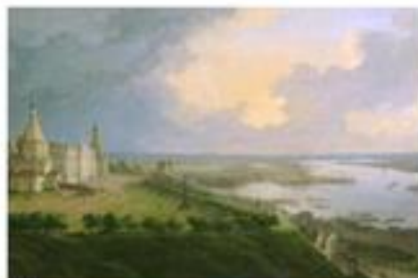
Н.Г. Чернецов Вид Нижнего Новгорода. 1837 г.