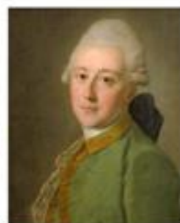
С. Рогов Портрет неизвестного гвардейского офицера. Конец 1760-е