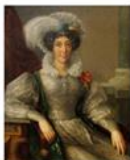
Неизвестный художник Портрет дамы в шубе с орденом св. Екатерины. 1830-40