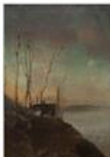
А.К. Саврасов Рыбачья лодка. Конец 1860-х – начало 1890-х гг.