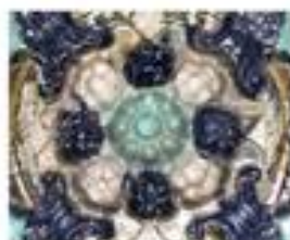
■ Что такое икрадец?

ЭТИ ИНТЕРАКТИВНЫЕ ЗАНЯТИЯ БУДУТ ИНТЕРЕСНЫ КАК ДРУЖНЫМ ШКОЛЬНЫМ КОЛЛЕКТИВАМ, ТАК И РОДИТЕЛЯМ С ДЕТЬМИ. ОПЫТНЫЕ ЭКСКУРСОВОДЫ В ДОСТУПНОЙ И КРАСОЧНОЙ ФОРМЕ ПРОВОДЯТ ЗАНЯТИЯ, КОТОРЫЕ ОБЫЧНО ЗАВЕРШАЮТСЯ МАСТЕР-КЛАССАМИ.