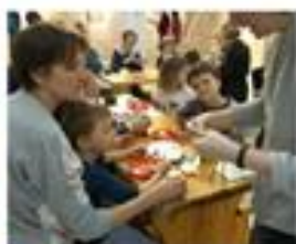
■ Пасхальная композиция