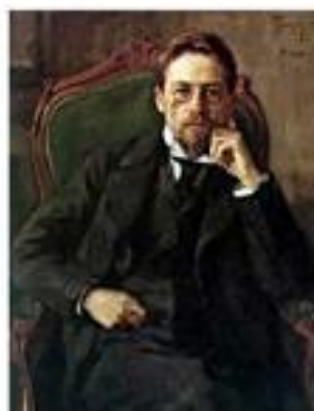
О. Репп Портрет А.П.Чехова