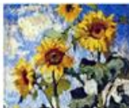
■ Цветы в искусстве