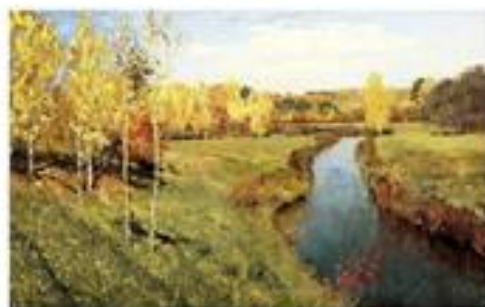
И. Левитан Золотая осень, 1895