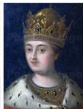
Исторический рисунок Шарена София

ЦЕЛЕВАЯ АУДИТОРИЯ: школьники среднего и старшего звена