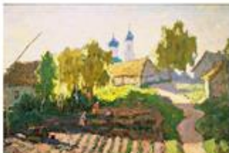
К.И. Горбатов Деревенский пейзаж с колодезью и церковью. 1920-е