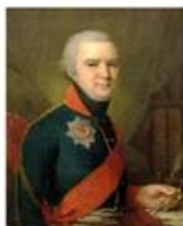
В. Боровиковский Портрет князя С.Г. Долгорукова. 1800

ЗАНЯТИЕ РАССКАЗЫВАЕТ О СТАНОВЛЕНИИ И РАСЦВЕТЕ ПОРТРЕТНОГО ЖАНРА В РОССИИ НА ПРИМЕРЕ ТВОРЧЕСТВА ОСНОВНЫХ МАСТЕРОВ И ПРОИЗВЕДЕНИЙ ИЗ СОБРАНИЯ МУЗЕЯ.