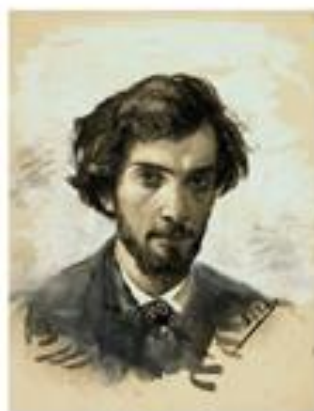
И. Левитан Автопортрет, 1880

ЛЕКЦИЯ ПО ЗНАКОМСТВУ С РАННИМ ПЕРИОДОМ ЖИЗНИ И ТВОРЧЕСТВА ДВУХ ТАЛАНТЛИВЫХ ЛЮДЕЙ СВОЕГО ВРЕМЕНИ ЧЕХОВА И ЛЕВИТАНА.