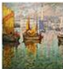
■ Знакомство с творчеством художника Горбатова