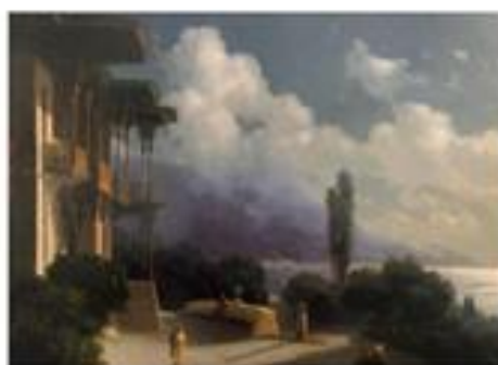
И. Алтманский Обзорность Яельского моста. 1866