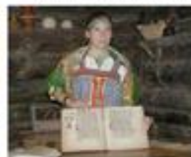
■ Истоки славянской письменности

Документ создан в электронной форме. № документа: 14-09-00721-06 от 14.09.2018. Уполномоченный: Митрохин С.А. Страница 18 из 25. Страница создана: 13.09.2018 13:40